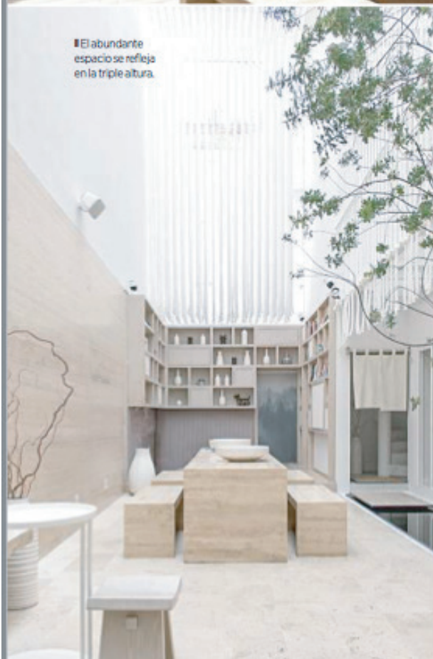
El abundante espacio se refleja en la triple altura.