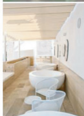
La terraza integra cinco tinajas para que los usuarios se relajen.