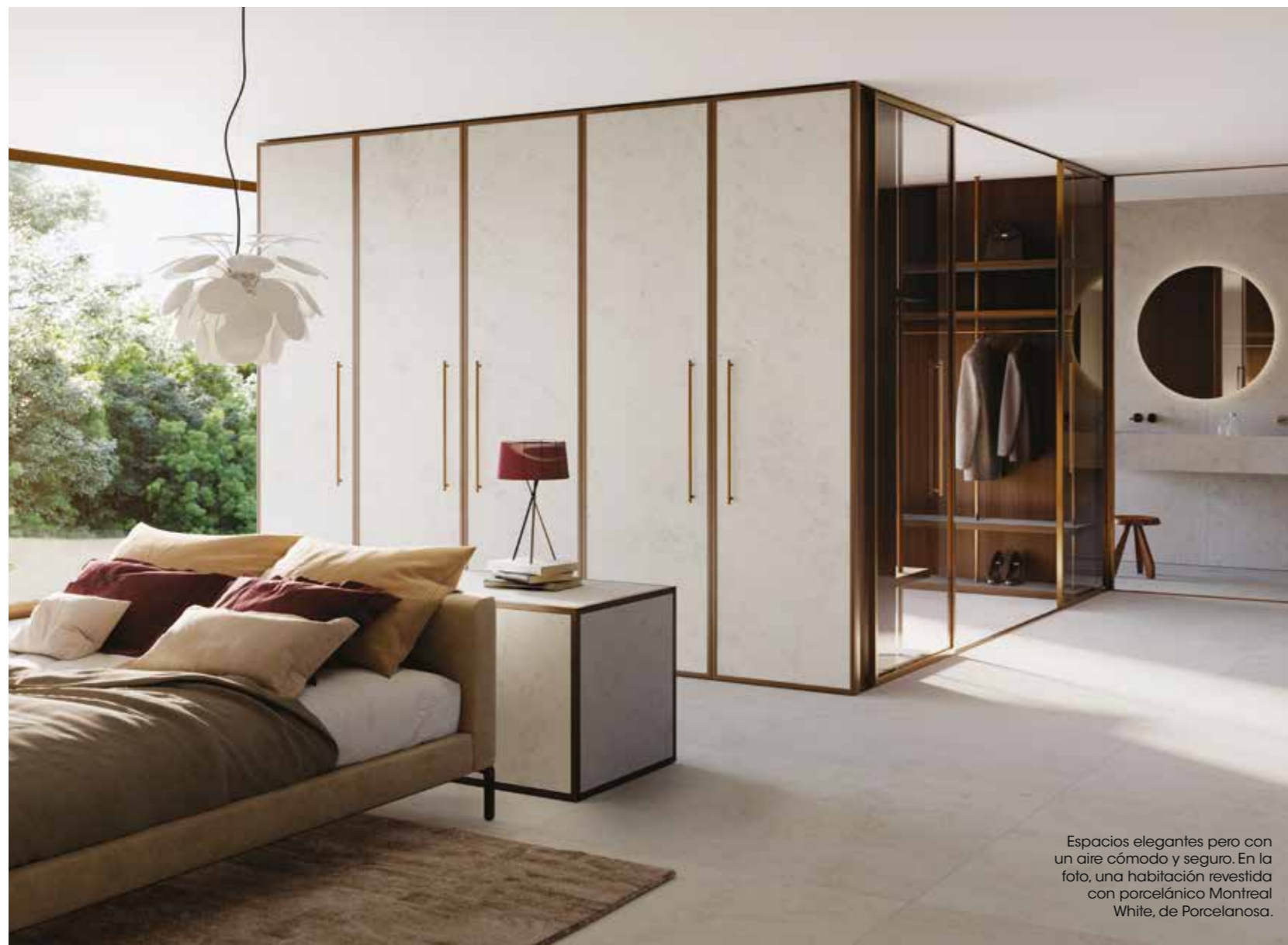
Espacios elegantes pero con un aire cómodo y seguro. En la foto, una habitación revestida con porcelánico Montreal White, de Porcelanosa.