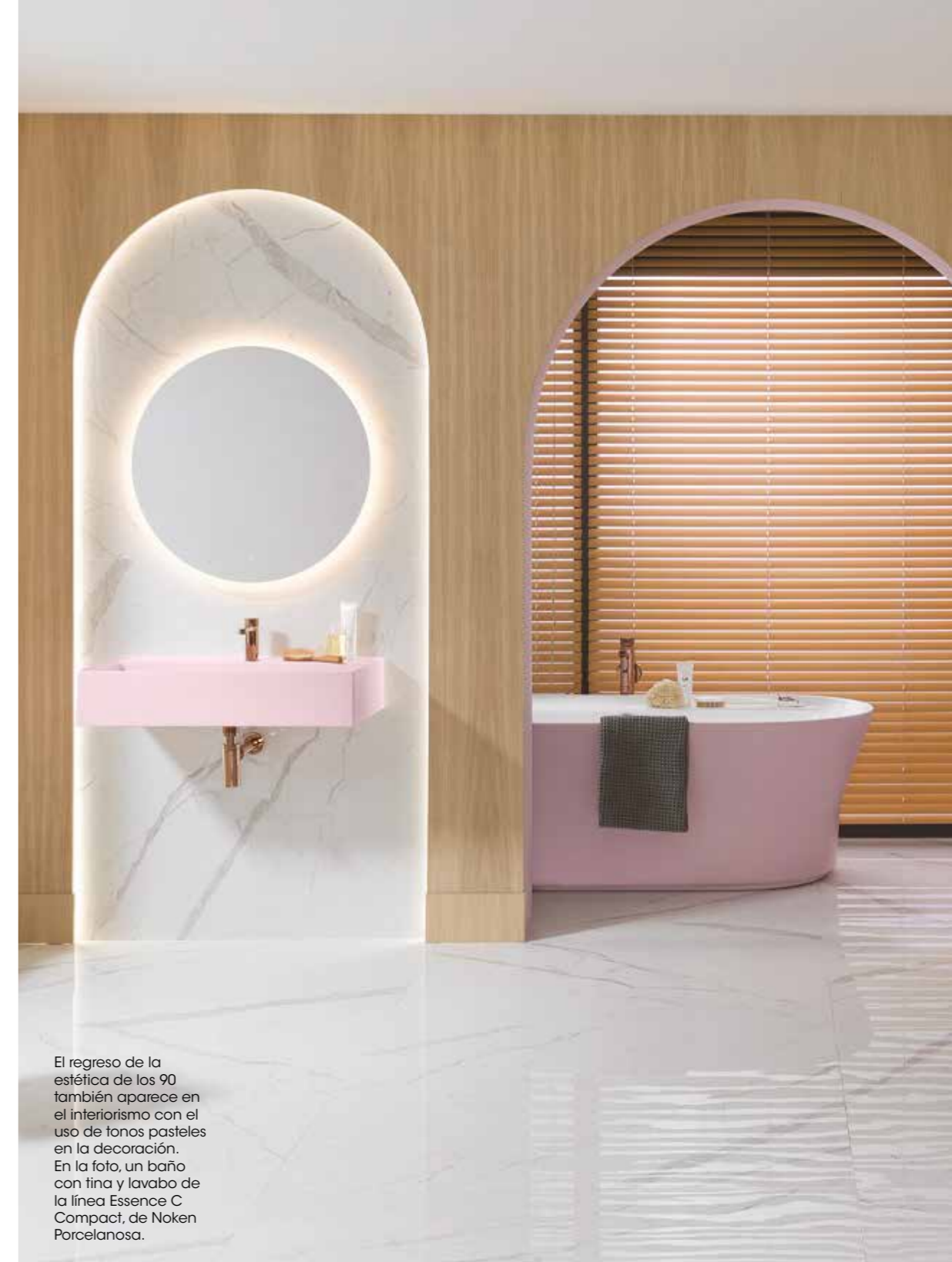
El regreso de la estética de los 90 también aparece en el interiorismo con el uso de tonos pasteles en la decoración. En la foto, un baño con tina y lavabo de la línea Essence C Compact, de Noken Porcelanosa.

«Tanto en el mobiliario como en los elementos decorativos, las formas orgánicas que imitan a la naturaleza, haciendo reflexión del cuidado del mundo natural, brindarán un toque acogedor a los ambientes y crearán atmósferas serenas. Toman protagonismo los muebles y accesorios de formas suaves y texturas y materiales naturales».