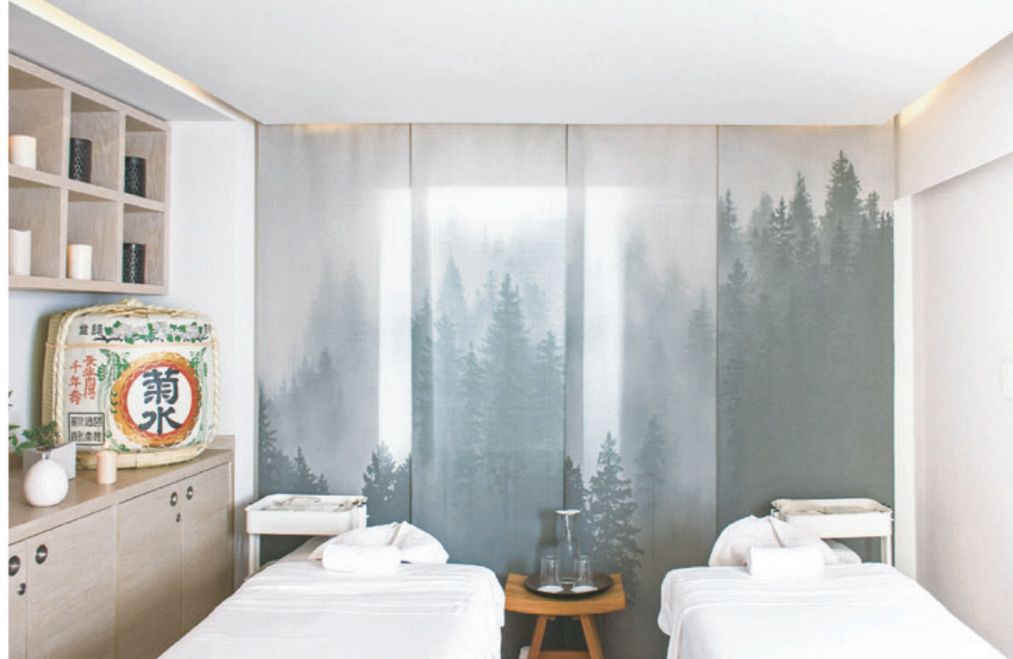
требностям каждого гостя. Их дизайн – отсылка к тысячелетним традициям построения киотских домов, и в то же время они отделаны лозой, использовавшейся в декоре жилищ