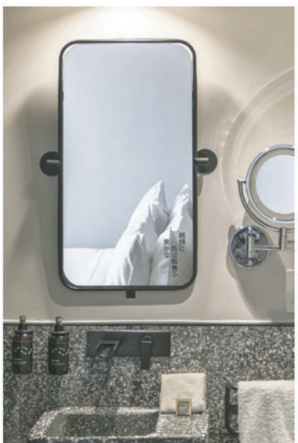
племен майя. Декоративное татами, традиционные восточные кровати, раздвижные двери и другие узнаваемые элементы японской культуры. При этом каждый номер оборудован высокотехнологичными новинками, которые легко персонализируются и значительно облегчают работу и досуг посетителей. Современность талантливо вписана в восточный дизайн, среди новейшей техники гости отеля